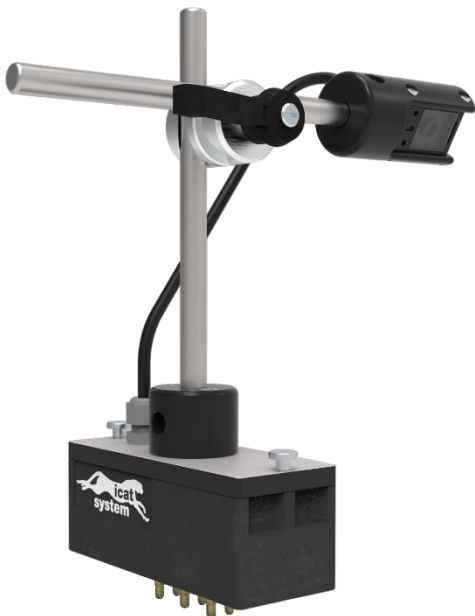
Anschauungsbild des iCATsystem vision mit Prüfbox

Das smarte Überwachungssystem aus der iCATsystem Produktfamilie für optische Prüfaufgaben!