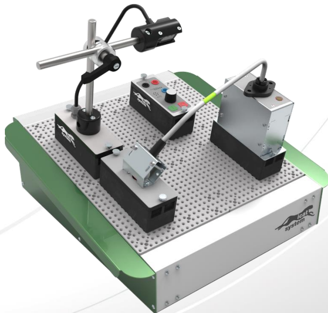
Anwendungsbeispiel eines kompletten Prüfplatzes zur Kontrolle einer farblichen Schutzummantelung

Es ist z.B. möglich Prüfungen von Kabelfarben, Anordnungen und Reihenfolgen innerhalb kurzer Einrichtzeit zu realisieren.