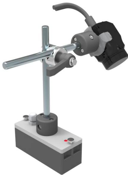
Anschauungsbild des Kameramodulaufsatzes mit Prüfbox

Das smarte Überwachungssystem aus der iCATsystem Produktfamilie für optische Prüfaufgaben!