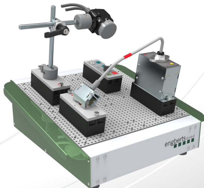
Anwendungsbeispiel eines kompletten Prüfplatzes zur Kontrolle einer farblichen Schutzummantelung

Es ist z.B. möglich Prüfungen von Kabelfarben, Anordnungen und Reihenfolgen innerhalb kurzer Einrichtzeit zu realisieren.